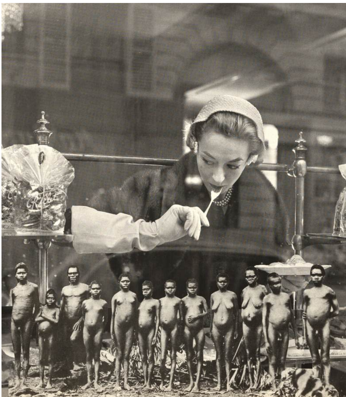
„Która sztuka najmniej kaloryczna”, kolaż analogowy

Niektóre dziewczyny są ubrane w wojskowe uniformy, a inne ubierają się zgodnie z rozkazami „dyktatorów” mody. Gdzie w tym wszystkim miejsce dla wolności wyboru? Gdzie wolność?