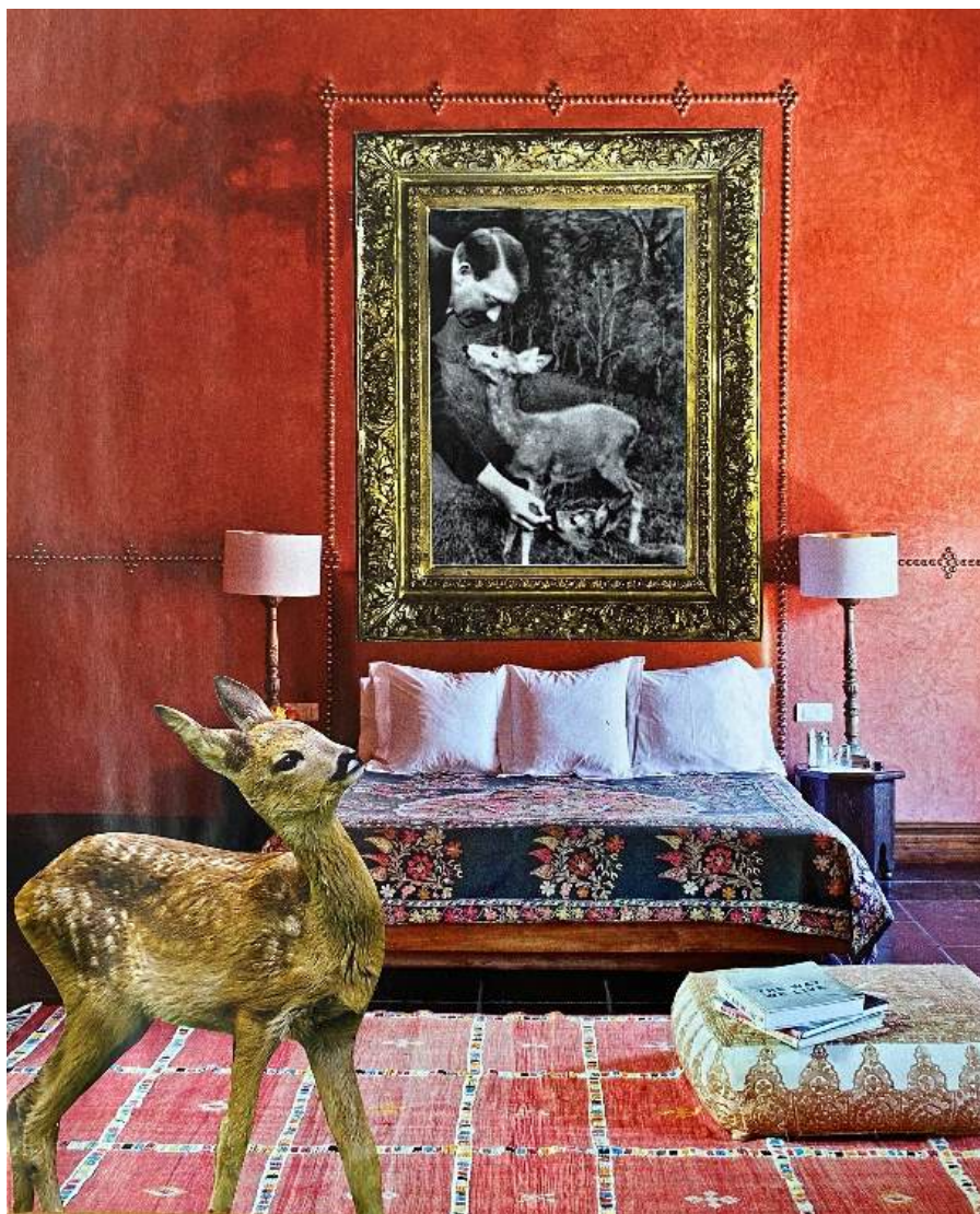
„Sarenka”, kolaż analogowy

My, ludzie, wymyślamy potężne technologie, ale czy pamiętamy, że nasze ciała są takie drobne i kruche, jakbyśmy byli nadzy wobec tych technologii. Jest coś niesamowitego w fakcie, iż jako gatunek wymyślamy coś niebywale potężnego, a jako ludzie dalej jesteśmy tacy delikatni, krusi, słabi. Może więc warto czasem przypomnieć sobie o fizyczności, kruchości naszych ciał, aby może z lepszej perspektywy patrzeć na innych, albo lepiej zrozumieć swoją własną sytuację?