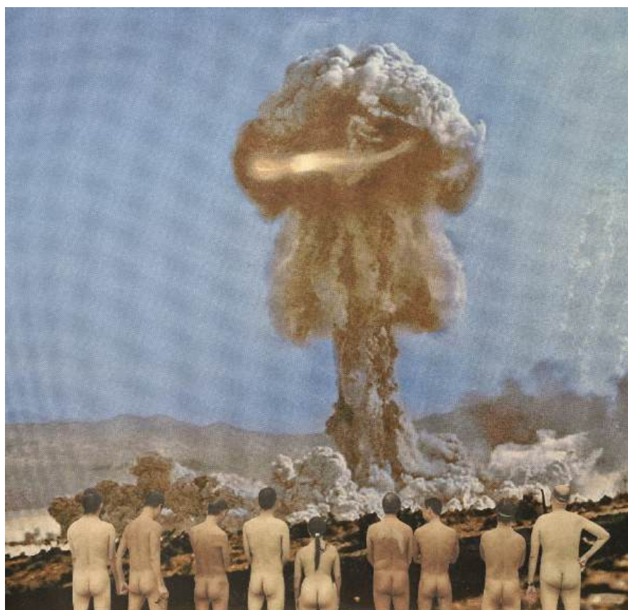
„Golasy na poważnie 3”, kolaż analogowy

Pomyślmy o terażniejszości. Pomyślmy o dzieciach Ukrainy, Palestyny i Iranu którym odebrano dzieciństwo, odebrano życie.