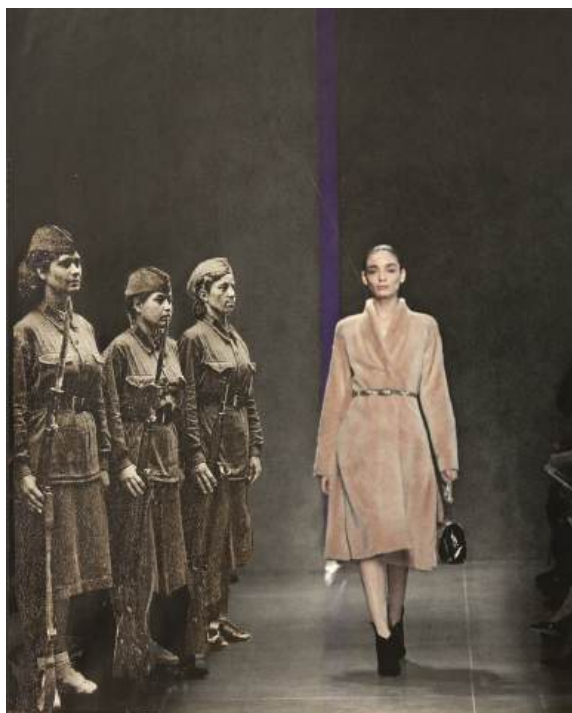
„Bez tytułu 2”, kolaż analogowy

Pierwszy „feministyczny” kolaż... Niektóre dziewczyny ciężko pracują, niektóre pracują nieco inaczej, jednak wszystkie znajdują się w tym samym świecie. Pojawia się pytanie: „Które z nich potrafią się bardziej śmiać?”