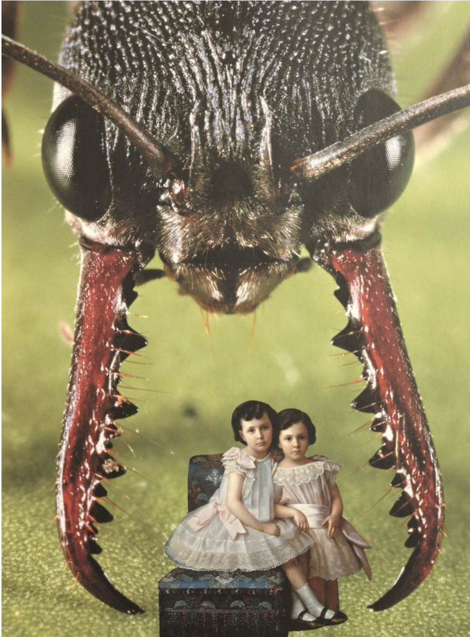
„W objęciach”, kolaż analogowy

Świat jest niebezpieczny, świat jest niebezpiecznym miejscem i może winniśmy sobie odrobinę czułości, współczucia, opiekuńczości? Świat nie jest dla nas generalnie nazbyt bezpiecznym miejscem, bez względu na to, jakie reformy czy innowacje technologiczne wdrożymy. W tym kontekście przypomina mi się słynna myśl Blaise’a Pascala o „trzcinie myślącej”: