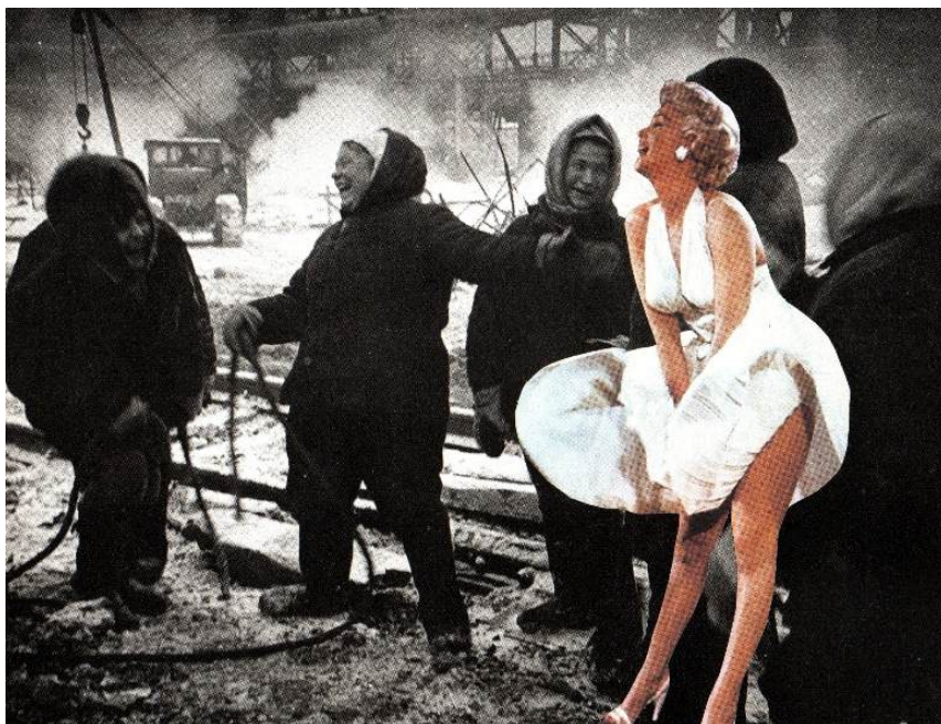
„Po zakończonej pracy włóż majtki”, kolaż analogowy

Wystawa „Dziwny jest ten świat” oferuje zwiedzającym trzy kolaże związane z problematyką kobiecą, feministyczną. To tematy szczególnie mi bliskie.