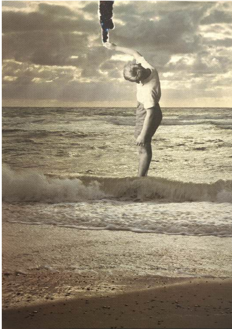
„Ściemnia się”, kolaż analogowy

ni do przekroczenia czy zanegowania moich interpretacji. Na tym właśnie, na krytycznej wymianie poglądów, buduje się bowiem wspólnota akademicka.