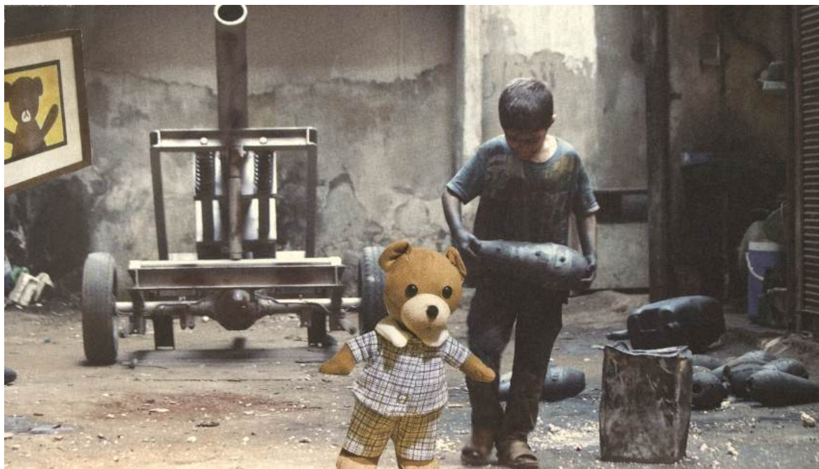
„Bez komentarza 4”, kolaż analogowy

Pomyślmy o terażniejszości. Pomyślmy o dzieciach Ukrainy, Palestyny i Iranu którym odebrano dzieciństwo, odebrano życie.